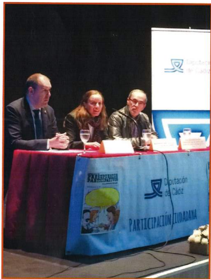
Presentación de la Jornada de presupuestos participativos, Jerez de la Frontera 19 de noviembre de 2015

Además, los procesos deben contar con un sistema de seguimiento y control social así como promover espacios deliberativos en su desarrollo.