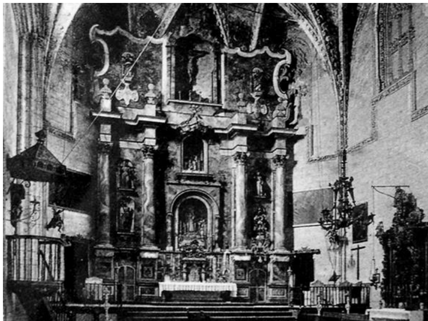
Parroquia de Nuestra Señora de la O. Interior (Foto L. Roisin, circa 1930)

14. En la sesión del 19 de octubre se dio cuenta de los gastos ocasionados en el flete de una lancha, alquiler de ancla y cadena y jornales invertidos en los auxilios prestados al bote "Corazón de Jesús", de la matrícula de Huelva, detenido en este puerto por sospecha de sanidad, por un importe de 25 pesetas, acordando el Ayuntamiento que se abonase con cargo a imprevistos.